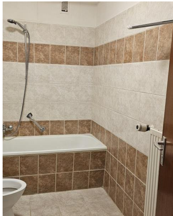
Bad mit Wanne