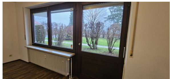
Blick zur Terrasse